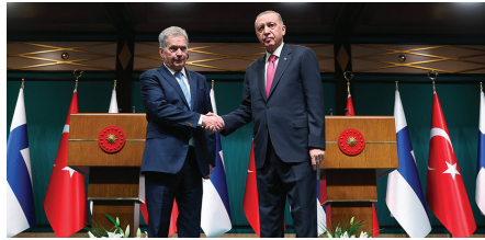
Adhésion de la Finlande à l'OTAN, avril 2023

1 LA MARCHÉ DU TEMPS. Une chronologie détaillée des événements politiques, économiques et sociaux de l'année 2023