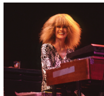
Carla Bley