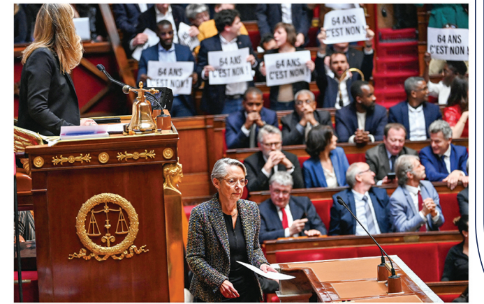
Élisabeth Borne à l'Assemblée nationale. Confrontée à une Assemblée nationale majoritairement hostile à son projet de réforme des retraites, la Première ministre Elisabeth Borne met fin aux débats le 16 mars 2023 en prononçant un discours dans lequel elle recourt à l'article 49, alinéa 3 de la Constitution. Celui-ci permet de considérer un texte comme adopté sans vote, si aucune motion de censure ne vient renverser le gouvernement. À l'arrière-plan, les bancs de la gauche manifestent leur opposition à cette mesure ainsi qu'à la réforme elle-même.

Les événements des années précédentes avaient freiné les ambitions réformatrices du chef de l'État. Après le mouvement des gilets jaunes (2018-2019), les confinements liés à la pandémie