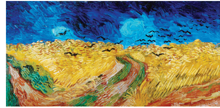
Champ de blé aux corbeaux, V. Van Gogh