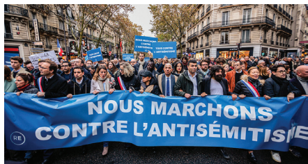
Marche contre l'antisémitisme à Paris, avril 2023

France : l'année politique 2023 • Économie mondiale : dureté financière, ralentissement et fragmentation des échanges • La maritimisation de l'économie • La Chine, une diplomatie tous azimuts • La Biélorussie indépendante : entre Europe et Russie • L'Allemagne d'Angela Merkel • Le Parlement européen • La démocratie participative • La liberté d'expression • La violence • La guerre franco-allemande (1870-1871) • Victoria, le portrait d'une époque • L'Affiche rouge • Une histoire des recensements de population • La sociologie du travail • La santé publique • Les troubles des conduites alimentaires • La mucoviscidose • Eiffel, le constructeur • La révolution Picasso • Colette, la fugitive • La littérature italienne, entre tradition et modernité • Le Templo Mayor. Révélation sur le monde aztèque • Le système solaire • Origine et évolution des oiseaux