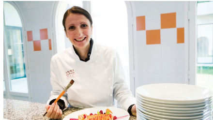
Anne-Sophie Pic