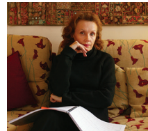
Kaija Saariaho

8 LE MONDE D'AUJOURD'HUI. Un état des lieux géopolitique de chaque pays de la planète, sous forme de fiches signalétiques