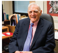
John Goodenough