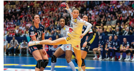
Finale du Championnat du monde féminin de handball 2023 : France-Norvège

Cyclisme : Vingegaard devant Pogačar à l'arrivée de la Grande Boucle • Handball : la France proche du doublé mondial • Natation : le phénomène Léon Marchand • Rugby : l'Afrique du Sud championne du monde