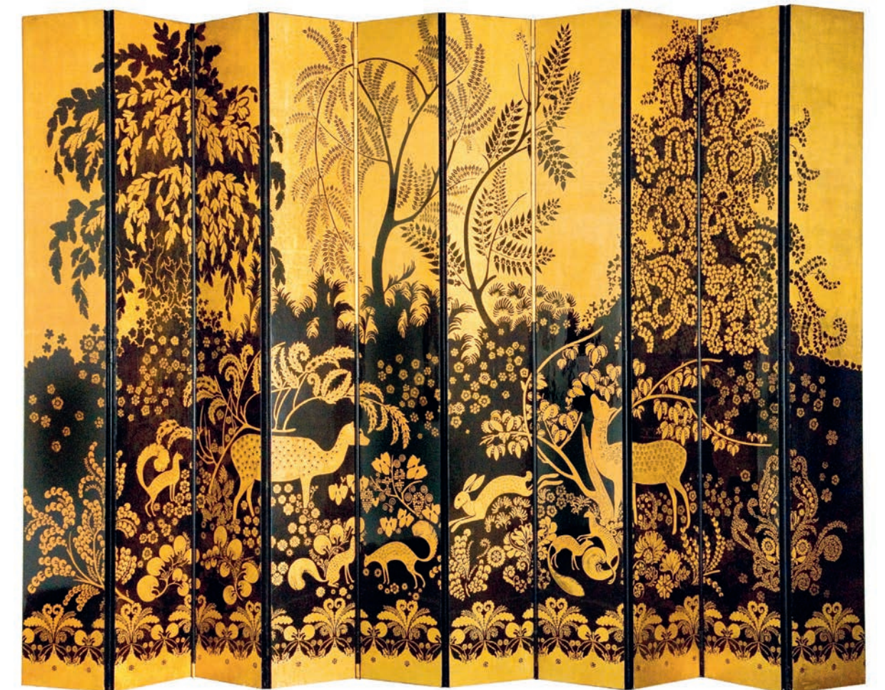
Paravent à dix feuilles créé par Armand-Albert Rateau, 1921-1922