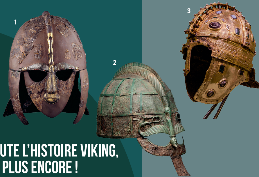
Ci-contre Casques de parade retrouvés dans 1. les tombes à bateau de Sutton Hoo (Angleterre, début du VII e siècle), à 2. Vendel (Suède, VIII e siècle), dans 3. le dépôt votif de Deurne (Pays-Bas, première moitié du IV e siècle)