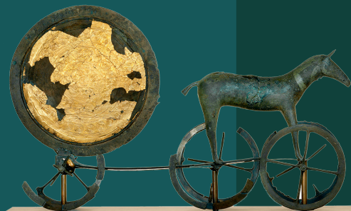
Ci-contre Chariot de Trundholm (Danemark, vers 1400 avant notre ère). Ce chariot était probablement un dépôt votif. Alliant cheval, char et soleil, cet objet exceptionnel reprend quelques-uns des éléments clés de l'idéologie et des croyances de l'Âge du bronze, en Scandinavie et même au-delà (le motif du char solaire est présent jusqu'en Grèce). Copenhague, Musée national du Danemark.