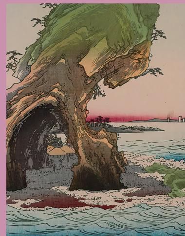
Sotogahama, estampe de Hiroshige dans la série des paysages célèbres des provinces du Nord (Ōshū) et de Sotogahama, 1859