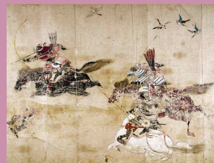
Guerrier japonais durant les guerres du Nord-Est à la fin du XI e siècle sur un rouleau peint dit « des guerres postérieures de Trois Ans » (XIII e siècle), ou Gosan nen kassen emaki