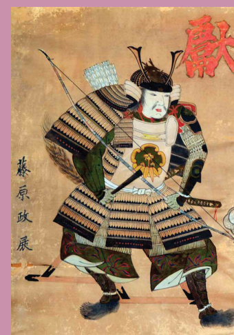
Ex-voto (ema) représentant des Aïnous rendant hommage à Minamoto no Yoshitsune