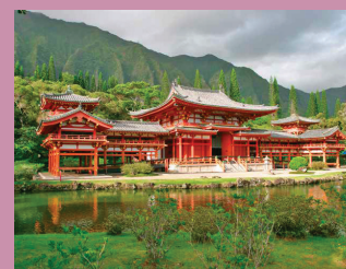
Le Byōdō-in d'Uji