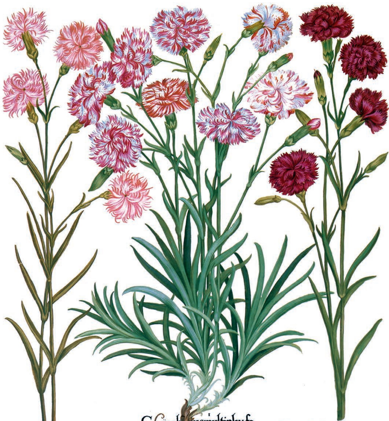
Caryophyllus multiplex flore carneo.