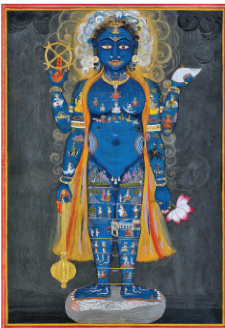
Viśvarūpa. École du Rajasthān, Jaipur, vers 1900. Gouache et or sur papier. Collection particulière