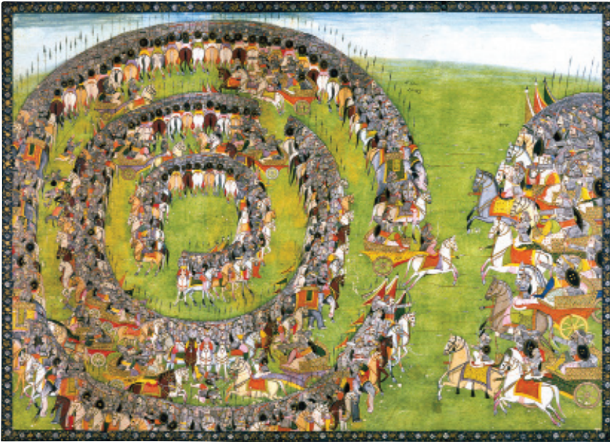
Les deux armées s'affrontent. École Pahari, Kanganer, vers 1820. Gouache et or sur papier. Collection particulière

Dans ce monde, je te l'ai déjà dit, ô très pur, il existe une double démarche : celle des penseurs qui font de la connaissance une ascèse, celle des ascètes du yoga qui en font une de l'action.