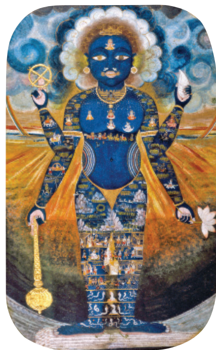
Viśvarūpa. École du Rājasthān, Jaipur, vers 1810-1820. Gouache et or sur papier. Collection particulière