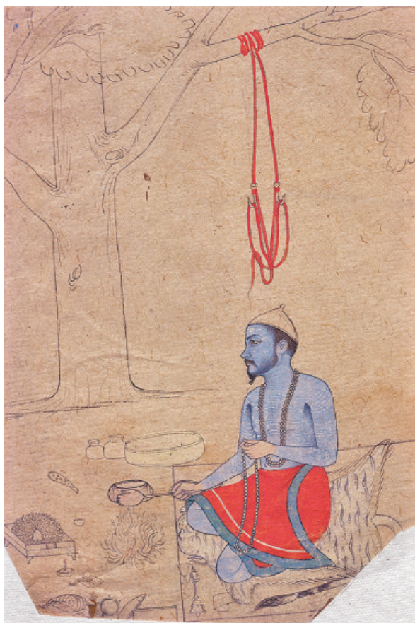
Ascète faisant une oblation au feu. École du Rājasthān, Bikaner, vers 1750. Dessin à l'encre et rehauts de couleurs sur papier. Collection Kumar Sangram Singh, Jaipur © Roland and Sabrina Michaud/akg-images.