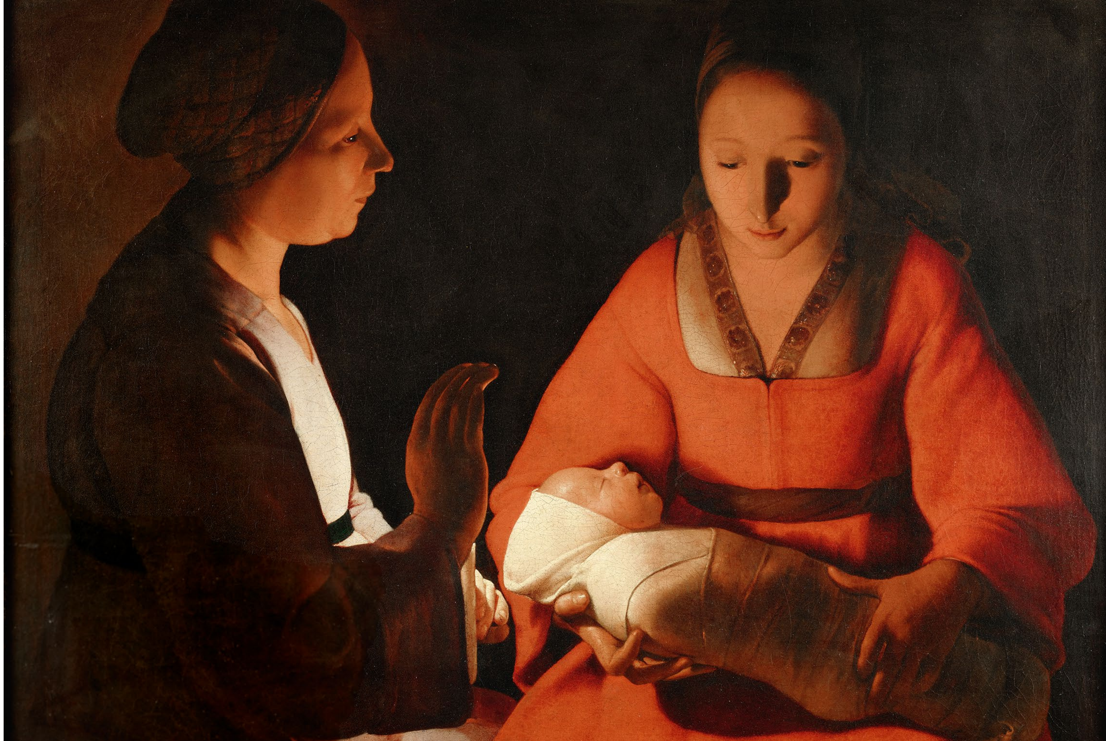
Le Nouveau-Né Détail Vers 1648 Huile sur toile 76 x 91 cm Rennes, musée des Beaux-Arts