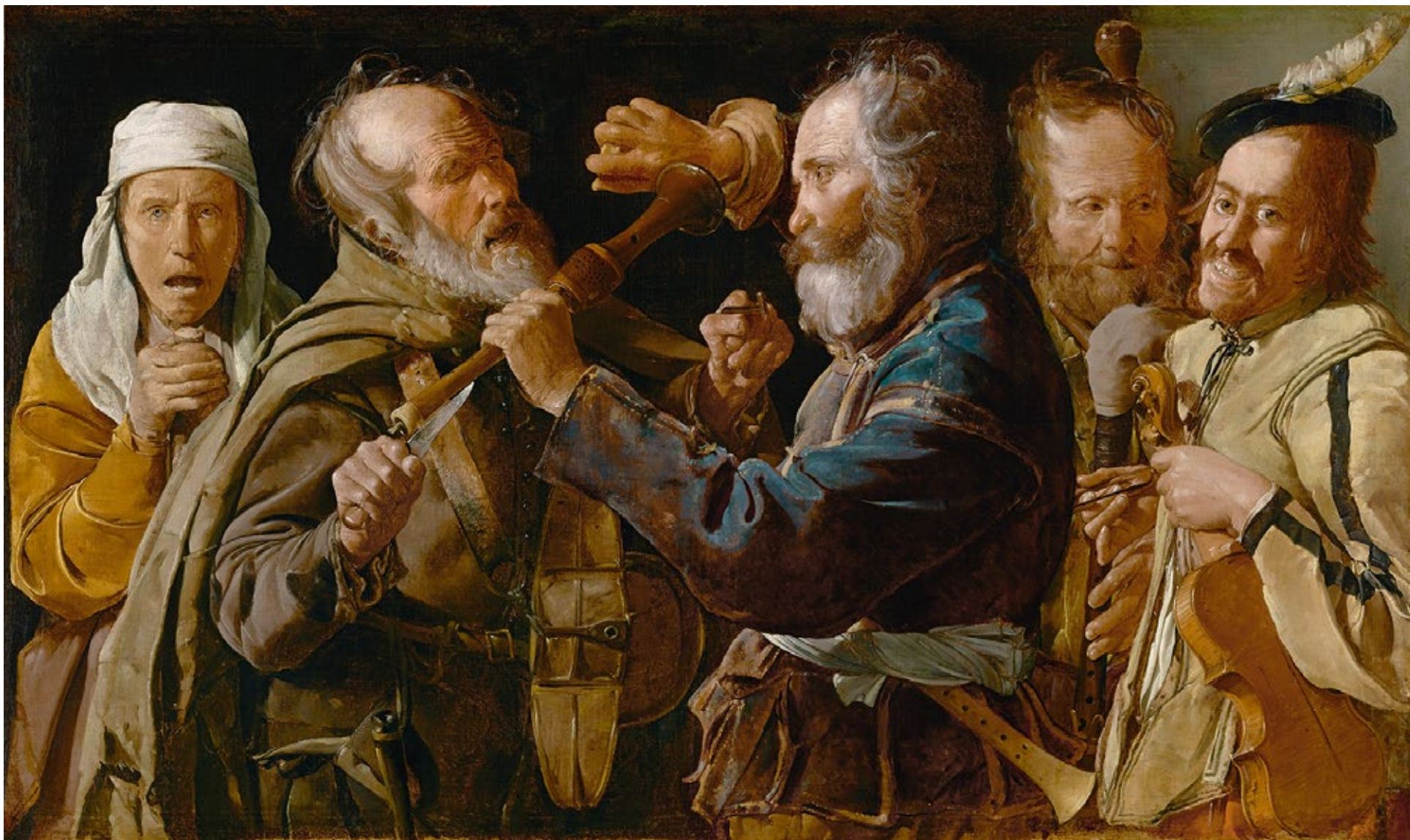
La Rixe de musiciens ou La Rixe Vers 1620-1625 Huile sur toile 85,7 x 141 cm Los Angeles, J. P. Getty Museum of Art