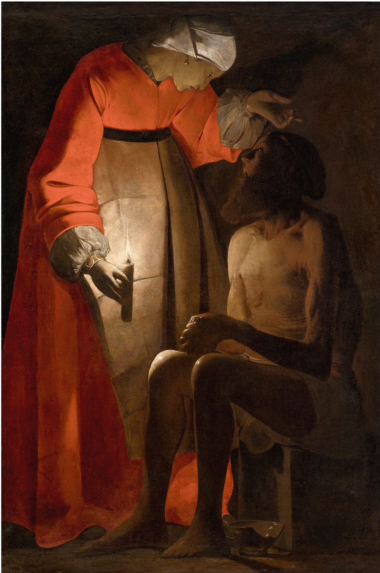
Job raillé par sa femme Vers 1632-1635 Huile sur toile 145 x 97 cm Épinal, musée d'Art ancien et contemporain