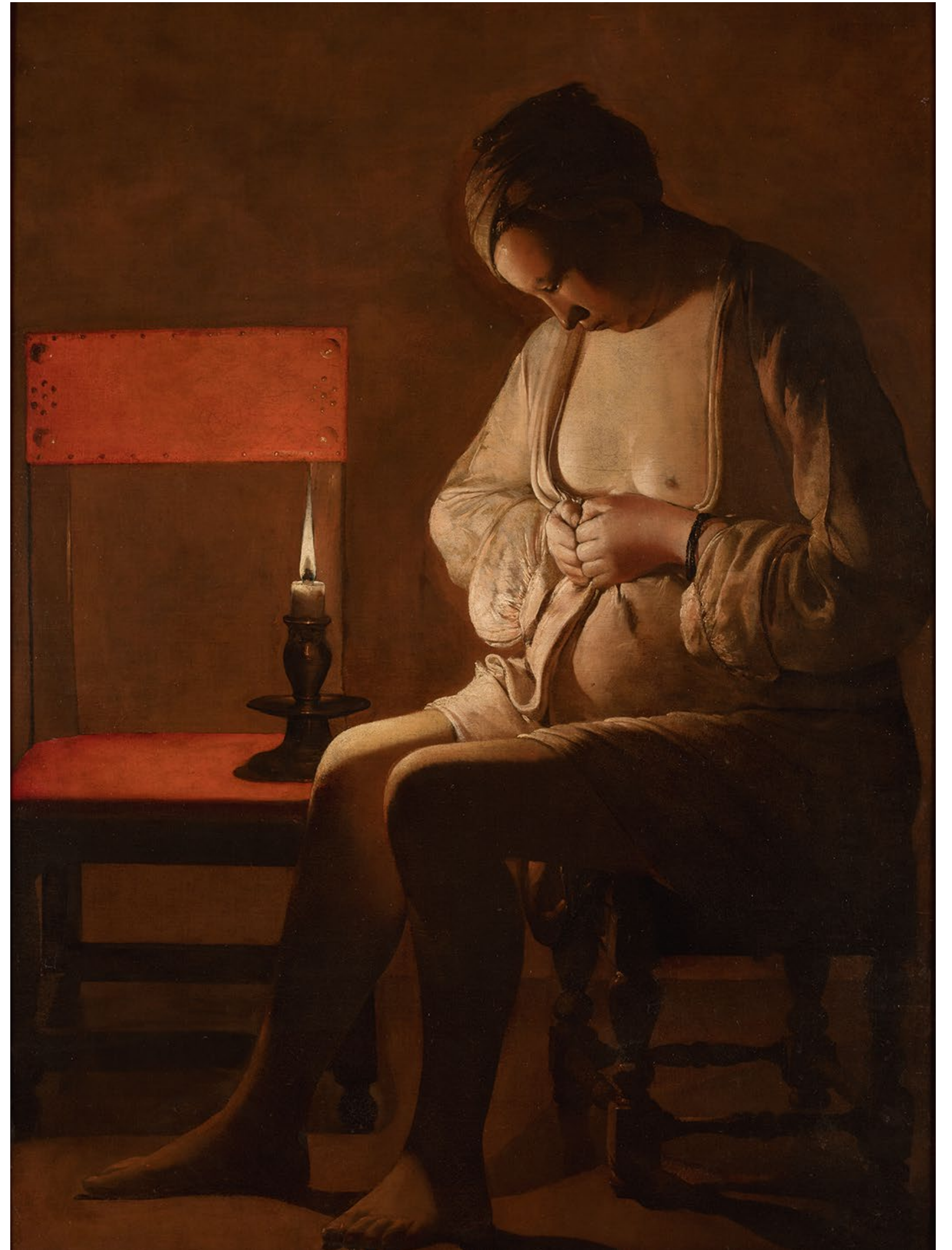
Page de droite La Femme à la puce Vers 1635 Huile sur toile 120 x 90 cm Nancy, Musée lorrain